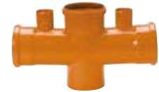
R. doble a 87°30' c/ doble ventilación 110x110x110