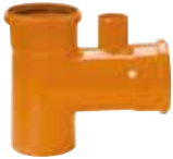
Ramal a 87° 30' c/ ventilación 110x110x110