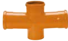
Ramal doble a 87°30' 110x110x110