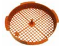
Rejilla antiplaga 110