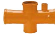
Ramal doble a 87°30' c/ ventilación 110x110x110